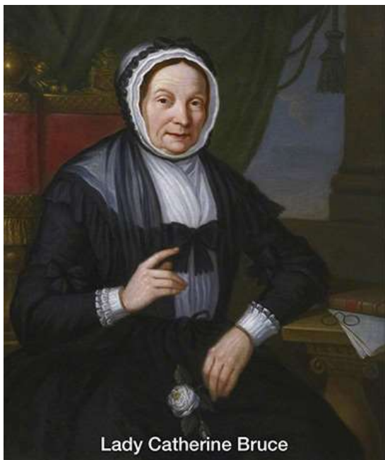
レディ・キャサリン・ブルース

1696年（松の廊下事件の5年前、元禄9年）に生まれたレディ・キャサリン・ブルースは、1314年にイングランド軍に勝利したロバート・ザ・ブルース王の子孫を公言し、ブルース・オブ・ニュートン&カウデン家の1人であった。彼女は第15代クラックマナン男爵のサー・ヘンリー・ブルースと結婚し、レディ・キャサリン・ブルース・オブ・クラックマナンとなった。レディ・キャサリンもヘンリーも筋金入りのジャコバイト派で、ヘンリーは1745年の反乱でボニー・プリンス・チャーリーとともに戦うほどであった。