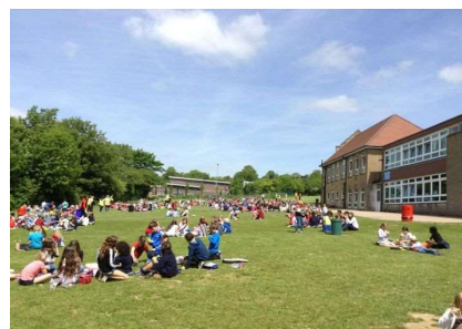
バルフォア通りの同名の小学校