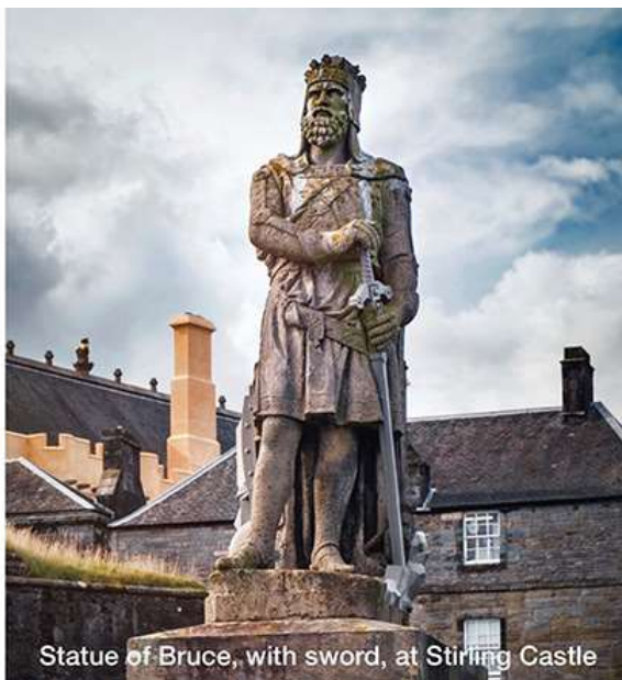
Statue of Bruce, with sword, at Stirling Castle

レディ・キャサリン・ブルースの死後、時折の公開以外、ロバート王の剣とかぶとはエルギン伯爵の居城ブルーム・ハウスで保管されていた。重さ3.6kg、刃渡り112cmの両手持ちの広刃剣である。剣はロバート王の息子デビッド2世からクラックマナン・ブルースに与えられた。デビッド2世は結婚したが子がなく、血統が途絶えるとわかったときであった。最近の公開は2018年であった。