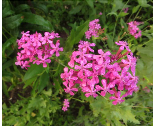
ノン・ソー・プリティの花 別名ロンドン・プライド