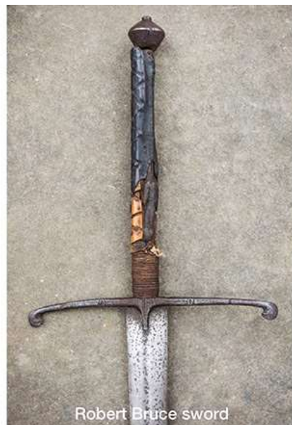
Robert Bruce sword