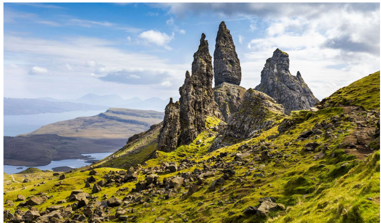
スカイ島のオールド・マン・オブ・ストア