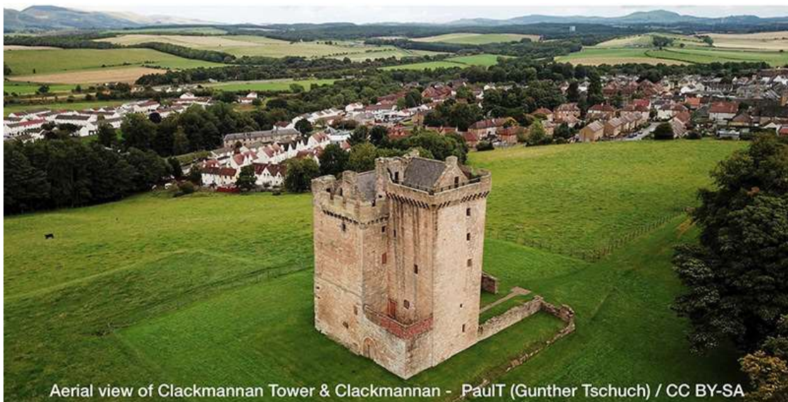
Aerial view of Clackmannan Tower & Clackmannan

ヘンリー・ブルースがロバート・ザ・ブルース王の子孫であることははっきりしているが、この記事は彼の妻、レディ・キャサリン・ブルースについて述べることを目的にしている。ニュートン&カウデン・オブ・ブルースの出自である彼女とロバート・ザ・ブルース王とのつながりはどうだったのだろうか？ レディ・キャサリンは夫と同じく、ロバート王とつながりを持っていたようである。ニュートン&カウデン・オブ・ブルース家は1449年に第4代クラックマナン男爵の次男によって設けられた。ということはヘンリー卿とレディ・キャサリンは遠く離れたところであった。