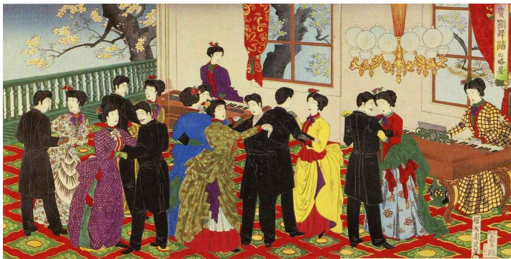
Ladies' Fancy が出版された 1886 年は鹿鳴館時代