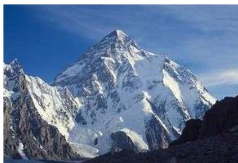
K2 パキスタンー中国国境にあり、標高は世界第2位の8,611m。「非情の山」として知られている。