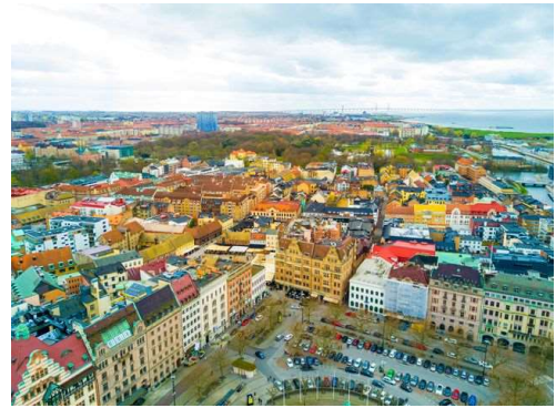
スウェーデンのイエテボリ市(Gothenburg)