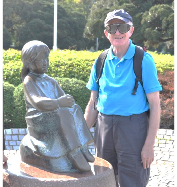
「赤い靴はいてた女の子像」とジョー2009年10月山下公園

酒はあまりたしなまず、ウイスキー、ビールよりもワインを好んだ。『赤ワインは冷やしちやいけなんだ!』と、赤ワインを冷やして出す日本の風習を怒っていた。『日本じゃハンバーグ・ステーキっていうのか。イギリスでは、ミンス・ステーキといった方が通じるよ』とも。