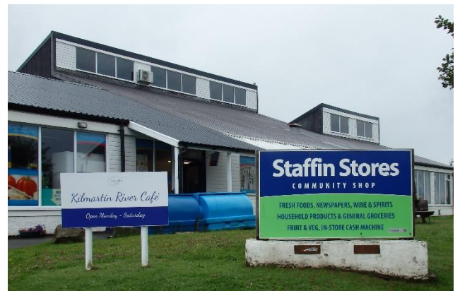
スカイ島スタフィン集落のコンビニ Staffin Harvest と関係があるかは不明